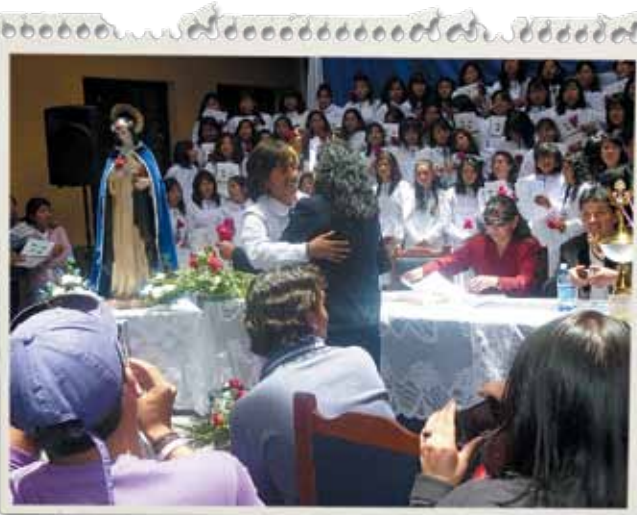
El 11 de diciembre se realizó la promoción del Colegio de Señoritas Santa Rosa, prestigioso establecimiento potosino.