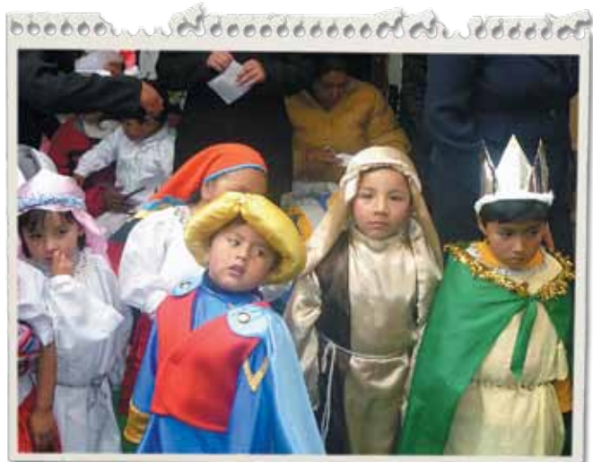
El lunes 21 de diciembre, alumnos del parvulario "Arco Iris" cerraron la gestión 2009, con una llamativa hora cívica.