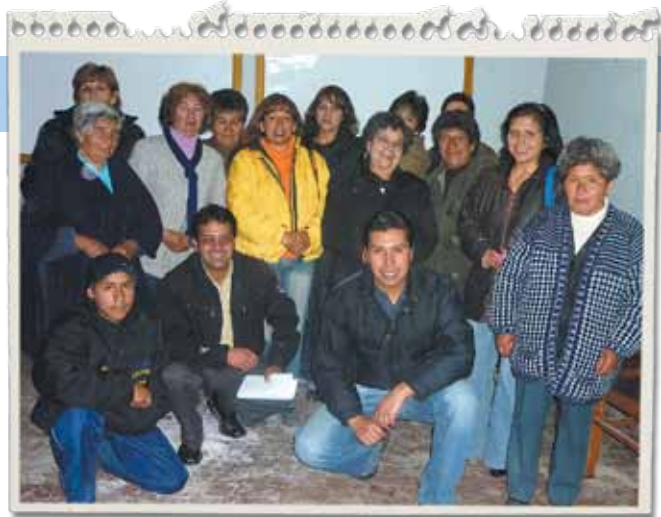
La primera semana de diciembre, personeros del Gobierno Municipal y locatarias del Mercado Artesanal participaron de un Taller de Capacitación.