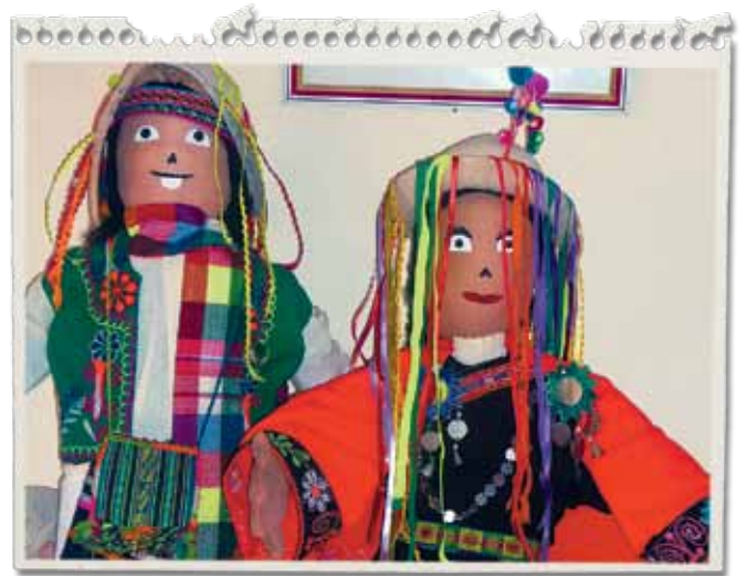
Pareja de "Potocos" de un metro de alto, confeccionada en los talleres artesanales de la Fundación Cultural "El Chasqui" y que en el mes de diciembre fueron enviados a EEUU.