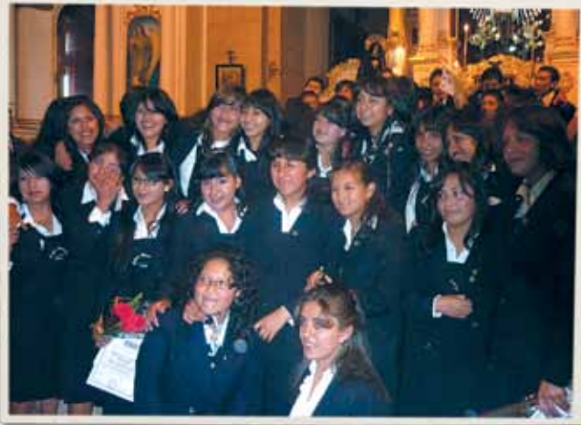
Un grupo de estudiantes de la Promoción del Colegio Católico Particular Franciscano minutos antes de celebrar el acto de egreso, el 4 de diciembre.