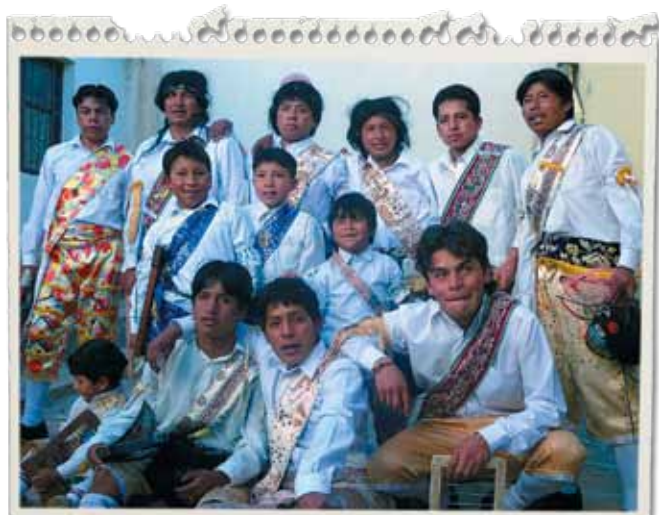
Grupo de "reque reques", pertenecientes a la Parroquia de San Pedro. Bailarines que adoran al niño en la celebración de la Navidad de Antaño.